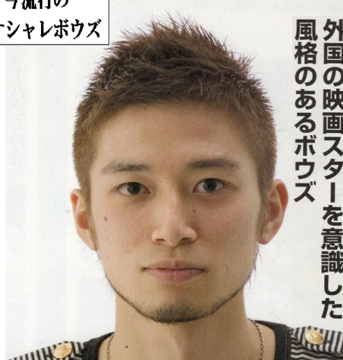
今流行の オシャレボウズ