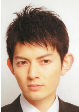
スピードカット 約10分 ¥1,700