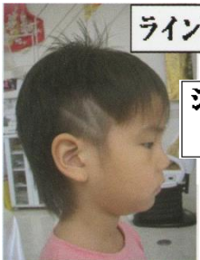
ジャニーズJr風カット ¥1,800