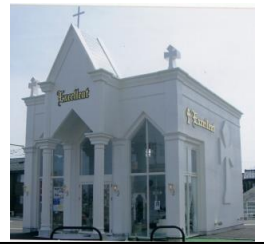
ブックオフさんの斜め向かい