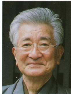
グレイカラー(白髪染め) ¥6,000→¥4,100