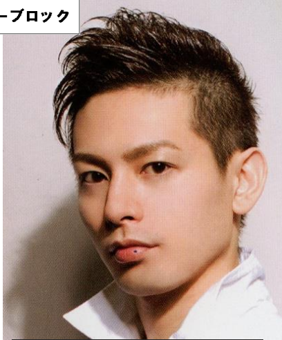
ツーブロックカット シャンプースタイルング ¥2,600