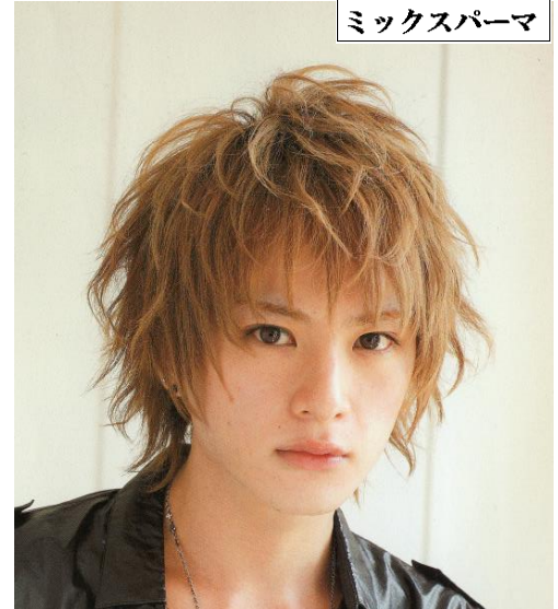
カット+パーマ+トリートメント ¥12,000→¥8,700 イケメンカラー ¥5,500