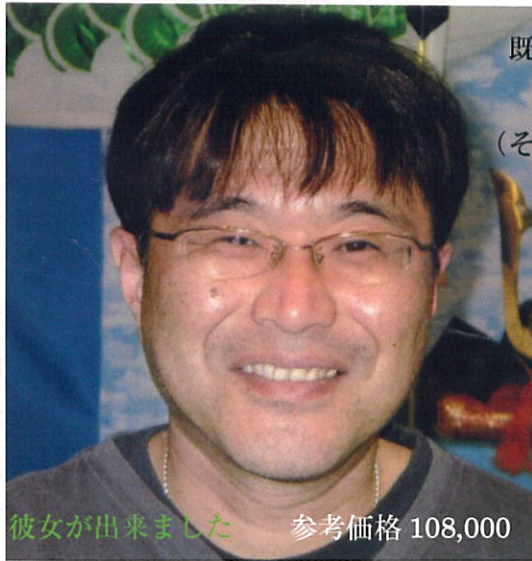
彼女が出来ました 参考価格 108,000

オーダーメイドは高いし 既製品はわざとらしくてイマイチ エクセレントのセミオーダー (その日のうちに付けて帰れます) セミオーダー150,000→100,000 エクセレントモニター85,000～ オーダーメイドより安いのに 仕上がりは上々 さらにモニター割引もあります 毛穴クレンジング、ヘッドスパ シャンプー爽快シャンプーあり